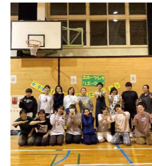
女子棟 レクリエーション