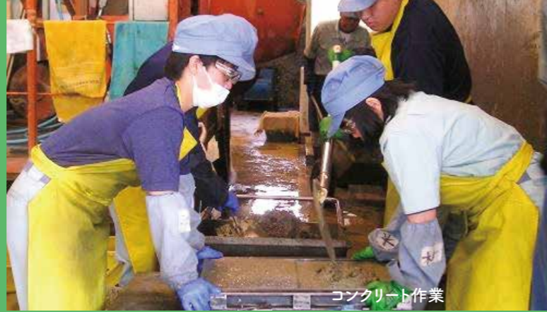
コンクリート作業

1年生で基礎作業を行い、2、3年生では木工、コンクリート、縫工、クリーニング、窯業作業の中から二つの作業種を学習します。また、卒業後の進路に向けて3年間で4回の現場実習を行います。1年生では1回(1週間)、2年生では2回(1週間、2週間)、3年生では1回(4週間)を行います。