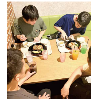
男子棟 外出レクリエーション